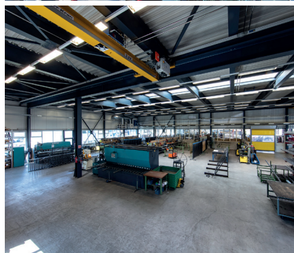
Oben: Das neue Bürogebäude und die Fabrikationshalle in Merenschwand | Rechts: Ein Blick in die Fabrikationshalle für den Stahlbau