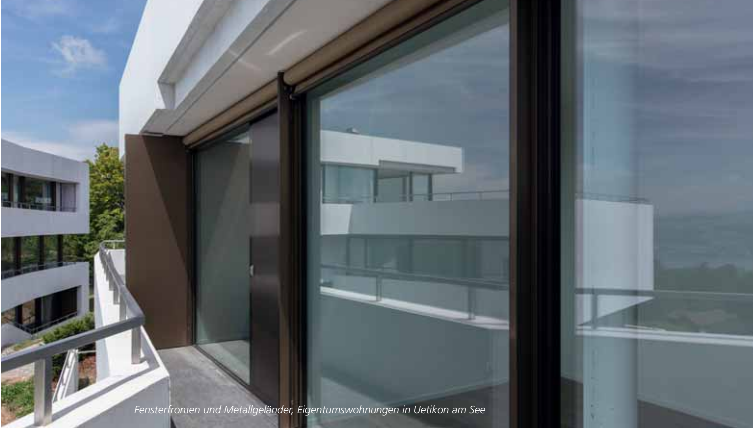
Fensterfronten und Metallgeländer, Eigentumswohnungen in Uetikon am See