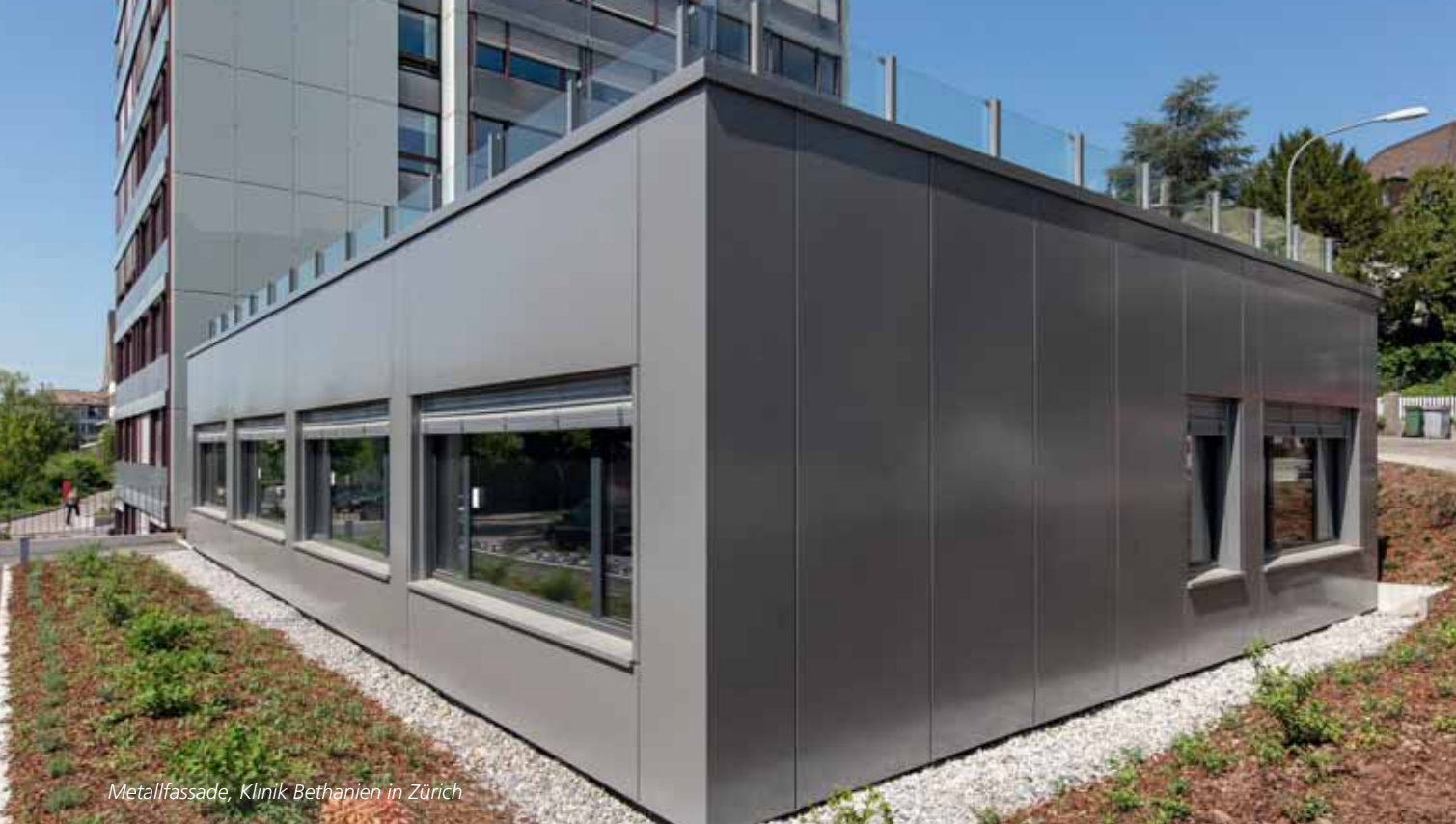
Metallfassade, Klinik Bethanien in Zürich