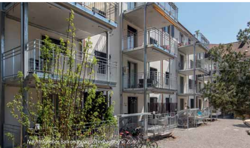
Nachträglicher Balkonanbau, Überbauung in Zürich