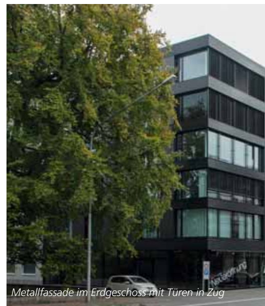
Metallfassade im Erdgeschoss mit Türen in Zug

Die Entwicklung von Projekten und Objektbetreuung ist Teamarbeit. Sie obliegt unseren Fachspezialisten, Metallbau-Technikern und Konstrukteuren mit der Philosophie «Swiss Perfection».