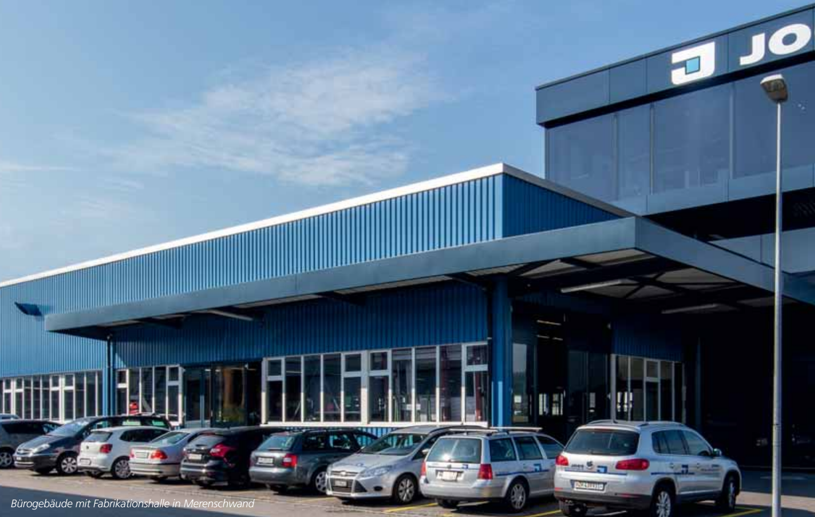
Bürogebäude mit Fabrikationshalle in Merenschwand