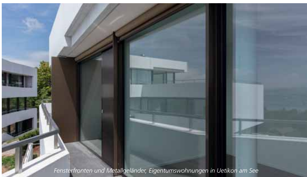
Fensterfronten und Metallgeländer, Eigentumswohnungen in Uetikon am See