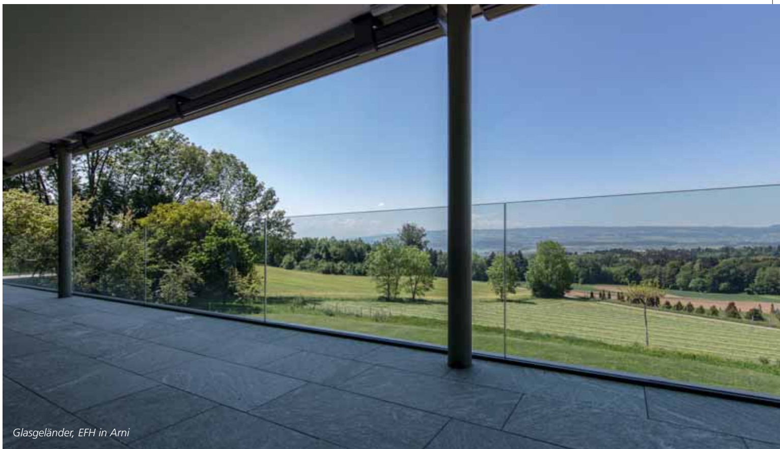
Glasgeland, EFH in Arni