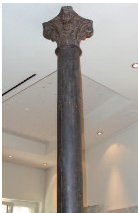
Über diese Säulen erfolgt die Kraftabtragung. Ce sont ces piliers qui supportent la charge de la construction.

> Ecken platziert sind. Als Rollenführung dienen eine direkt auf den Trägern liegende Halbrundschwelle und ein innenliegendes Schienensystem. Angetrieben wird das fahrende Glasdach über einen auf der Stahlkonstruktion befestigten Trommelmotor mit Seilzug. Am oberen Dachrahmen ist eine Umlenkrolle befestigt, welche gewährleistet, dass der Seilzug in beide Richtungen (auf / zu) erfolgen kann.