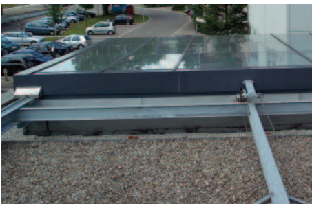
Seilzug, Umlenkrolle und Trommelmotor gewährleisten eine geräuscharme Bewegung.

Quatre paires de galets supportent l'ensemble guidé sur des rails intérieurs.